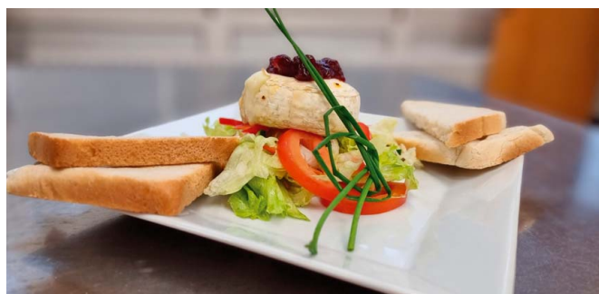
✔ Grilovaný hermelín s brusinkami na ledovém salátku