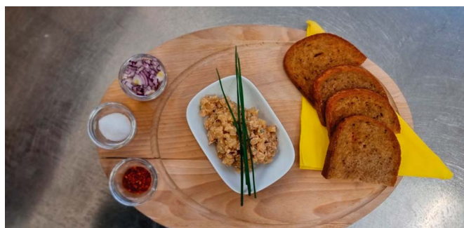
✔ Tvarůžkový tatarák s dipem