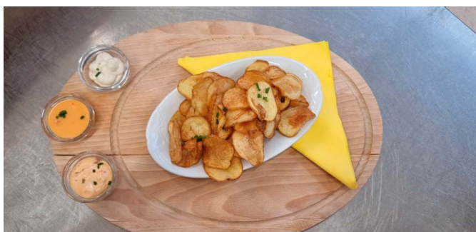
✔ Domácí bramborové chipsy s dipy.