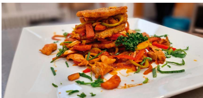
✔ Lázeňská směs, bramboráčky

Věděli jste, že naše kavárna pro Vás od pátku do neděle vaří spoustu vynikajících jídel? Stavte se na něco k zakousnutí i Vy! Pro tyhle a další dobrotu se můžete stavit do naší kavárny, která se nachází ve 2. patře Rehabilitačního sanatoria .